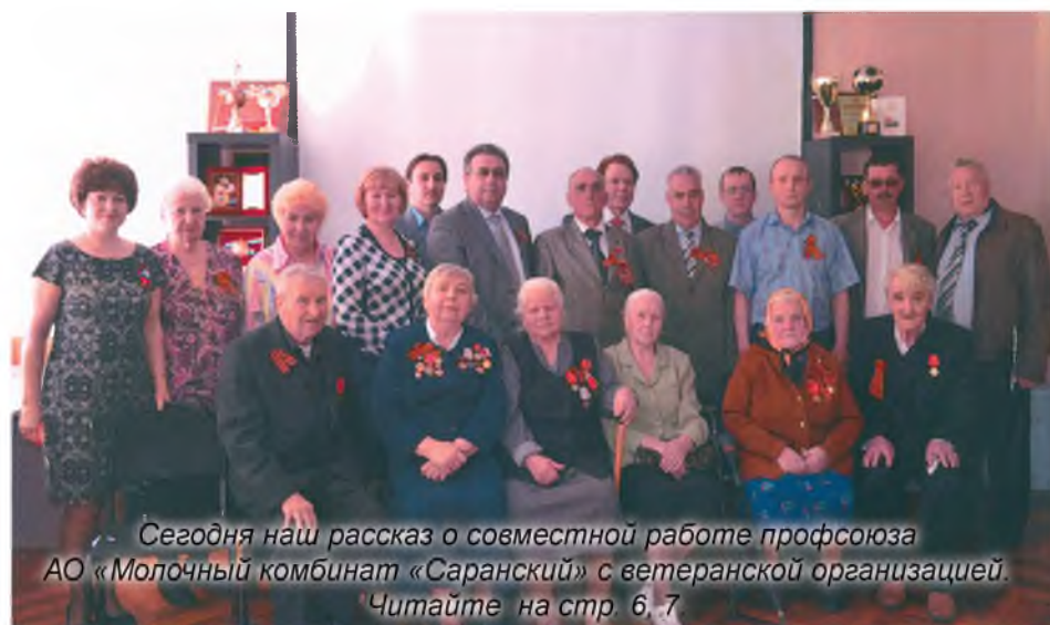
Сегодня наш рассказ о совместной работе профсоюза АО «Молочный комбинат «Саранский» с ветеранской организацией. Читайте на стр. 6-7.